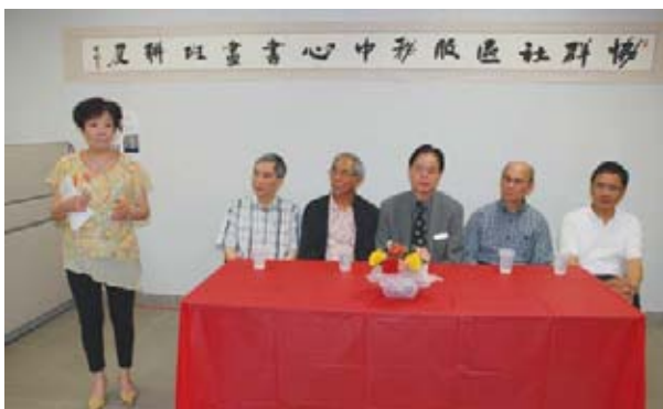
■主辦方在記者會上介紹活動詳情。

書畫展免費入場，開放時間為中午12時至下午5時，剪綵儀式定於7月10日中午12時，主辦方將於當天下午2時邀請著名畫家陸裔芸等現場示範作畫。全場展品可供售賣，所得款項部分捐作中心經費。